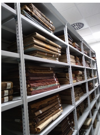
Fig. 2. Almacenamiento de los libros apilados en armarios compactos.