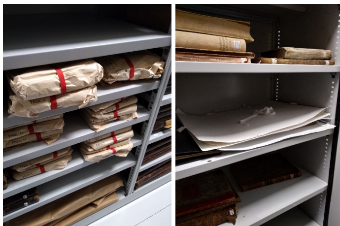
Fig. 3. Periódicos almacenados en paquetes de papel Kraft.