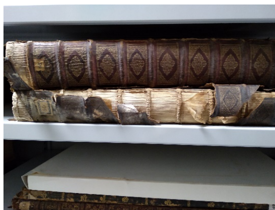
Fig. 1. Ejemplo de deterioro físico del lomo de uno de los ejemplares de la colección.

Los ejemplares con la signatura 62/x se encuentran en especial mal estado de conservación, en notable contraste con la colección de periódicos que se encuentra, en general, en muy buenas condiciones. Otras obras presentan acusadas alteraciones por actuación de microorganismos e insectos bibliófagos, que han dañado los elementos constituidos por celulosa, así como alteraciones químicas producidas por el propio envejecimiento del papel y las condiciones en las que se han encontrado almacenados a lo largo de los siglos, como foxing , manchas de humedad, encuadernaciones débiles o desgarrros (fig. 1), muchas de ellas también producidas por la conjunta acción del ser humano y el uso de los ejemplares.